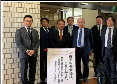
2月17日、確定申告無料税務相談会を税理士会の皆さんとともに視察。確定申告は、コロナウイルス対策で4月16日まで延長。