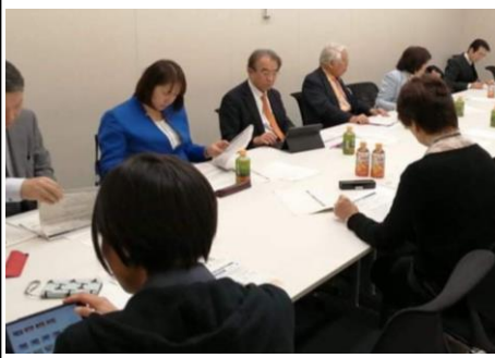
2月2日、第2回公的病院再編・統合問題ヒアリング。