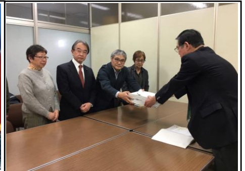
1月21日、名古屋の市民団体の関係者が短期間で集めたネット署名「中東派遣を止める署名」4万1040筆を内閣府に提出。