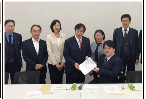
2月13日、障がい者・難病政策推進有志議連のヒアリング。