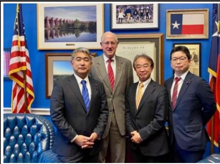
1月14-18日、ワシントンD.C. 訪問。上・下院議員と意見交換。