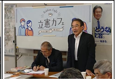
2月22日、第15回立憲カフェを事務所2階で開催。