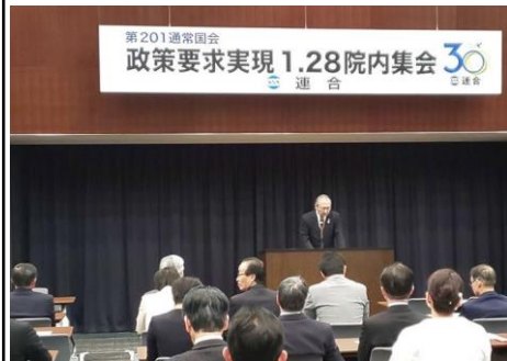
1月28日、連合の政策要求実現院内集会に参加。