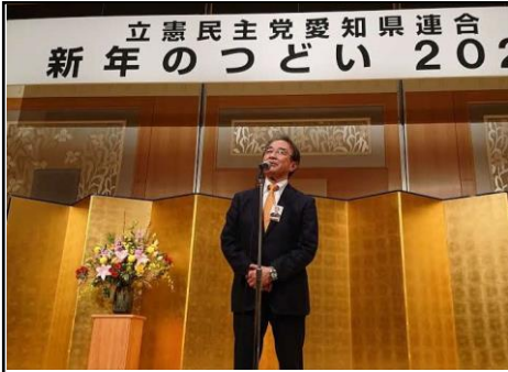
1月14日、立憲民主党愛知県連合新年のつどいで県連代表として挨拶。