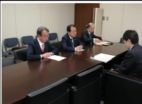
2月19日、交運労協の皆さんのコロナ対策申し入れで国交省など同行。